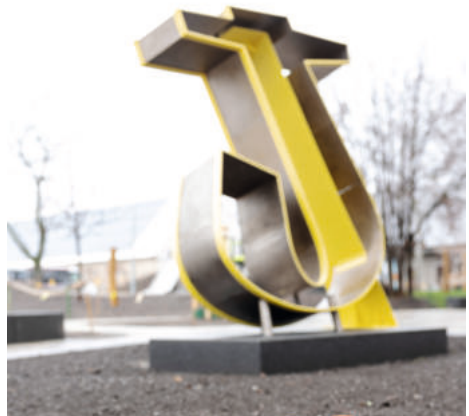
Johannes-Schule Merseburg

Das gemeinsame Durchschneiden des Bandes durch Vertreterinnen und Vertreter der Schule, der Schulstiftung und der Schulgemeinschaft markierte den offiziellen Startschuss für die Nutzung der neuen Anlage.