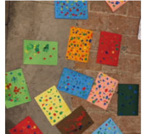
Wir basteln unser Liederbuch

Viele tragen zum Gelingen bei: Mit Musik, beim Aussuchen der Geschichten und Lieder, beim Basteln und schließlich auch zum leiblichen Wohl.