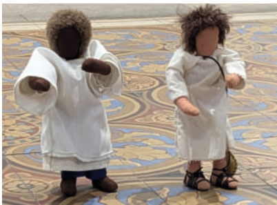
Singen befreit. Paulus und Silas singen

Zur eher ungewöhnlichen Gottesdienstzeit Freitag um 17.00 Uhr kommen Kleine und Große, Junge und Ältere im Altarraum der Stadtkirche zusammen um zu feiern: Mit Liedern, die man ganz schnell auswendig lernen kann, mit Geschichten aus der (Kinder-) Bibel