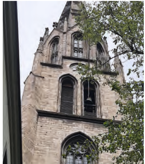
Kurz vor dem Ziel