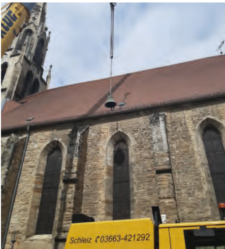
Die Glocke am Kran

Die Glocke der Kapelle Freimfelde wurde vor dem zweiten Weltkrieg in Auftrag gegeben. Dann wurde sie einbezogen, aber nicht eingeschmolzen. 1954 fand die Glocke ihren Sitz im Glockenturm der Kapelle Freimfelde. Nach der Entwidmung der Kapelle im Januar 2025 wurde die Glocke in den Eingangsraum der Stadtkirche versetzt. Dort stand sie bis zum Morgen des 24. Aprils 2026. Nun ergänzt sie das Geläut der Stadtkirche.