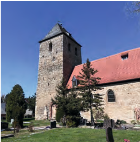
St. Georg Geusa